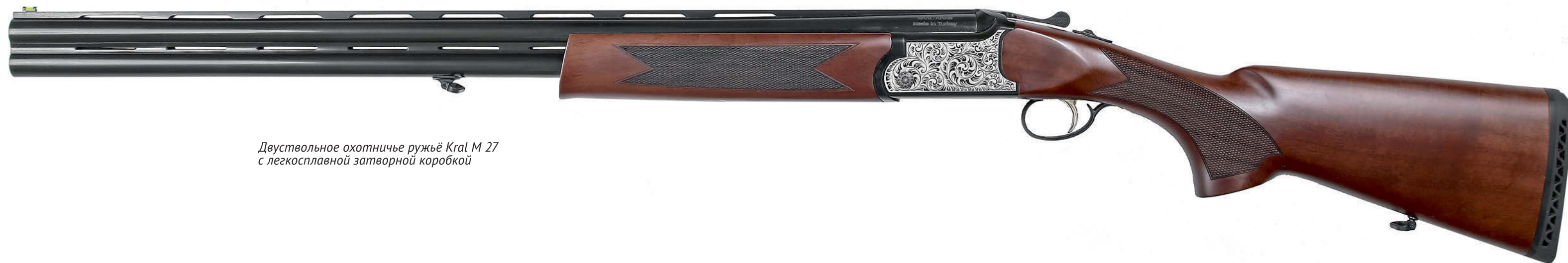
Двустольное охотничье ружьё Kral M 27 с легкосплавной затворной коробкой

Таким образом, в нашем полку двустольных охотничьих ружей бюджетного класса состоялось приятное пополнение. Наряду с приятным дизайном, качественным исполнением, хорошим балансом и посадистостью, ружья Kral оказались вполне доступны массовому российскому охотнику по цене, что сегодня немаловажно. Думаю, в условиях когда прилавки российских оружейных магазинов не балуют нас разнообразием недорогих ружей, именно Kral M27 вполне может стать востребованной и добротной рабочей лошадкой.