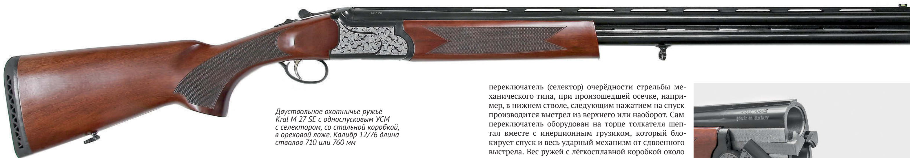
Двустольное охотничье ружьё Kral M 27 SE с односпусковым УСМ с селектором, со стальной коробкой, в ореховой ложе. Калибр 12/76 длина стволов 710 или 760 мм

и её защёлки. Внутри коробки размещён ударно-спусковой механизм (УСМ) распространённого среди крупносерийных вертикалок рамочного типа. УСМ курковый, односпусковой с механическим переключателем (селектором) последовательности стрельбы, боевые пружины цилиндрические витые, шептала верхние без предохранительных взводов. Бойки подпружинены. Перехватыватель курков (интерсектор), как и во многих других бюджетных зарубежных ружьях (и не только), отсутствует. Кнопка переключателя (селектора) совмещена с кнопкой предохранителя и работает (переключает очередность стрельбы), когда предохранитель включен (кнопка в заднем положении). При сдвинутой кнопке вправо (слева виден индекс U) первым работает правый курок, стреляет нижний ствол. При перемещении кнопки влево (справа виден индекс O) первым работает левый ударный механизм и верхний ствол.